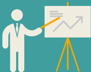
trener: Maciej Podraska